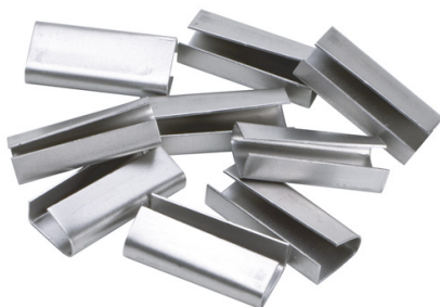
Grapas. Unidades abiertas.